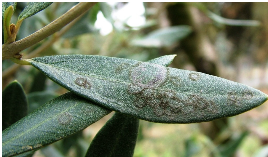
Κυκλικές κηλίδες στην πάνω επιφάνεια των φύλλων