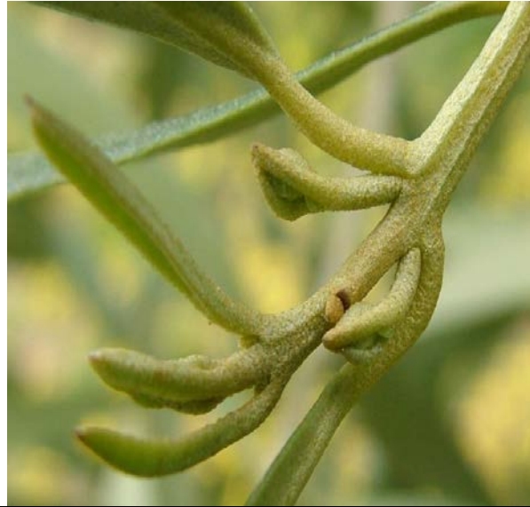
Μήκος νέας βλάστησης 2 - 5 εκατοστά